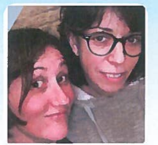
Les déserteuses #127