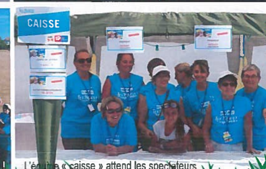
L'équipe « caisse » attend les spectateurs