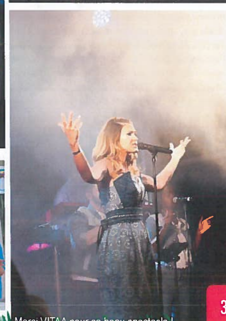
Merci VITAA pour ce beau spectacle !