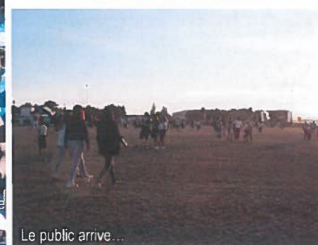
Le public arrive...