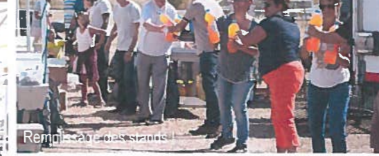
Remise de commémoratifs