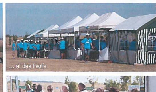
... et des tivolis