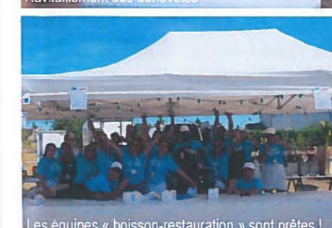
Les équipes « boisson-restauration » sont prêtes !