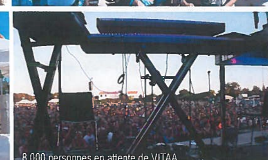
8 000 personnes en attente de VITAA...