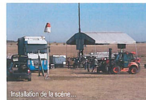
Installation de la scène...