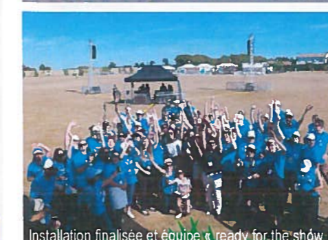
Installation finalisée et équipe « ready for the show » !