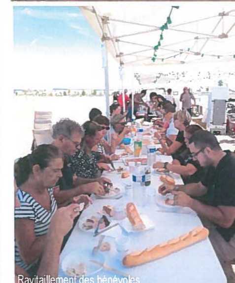
Ravitaillement des bénévoles