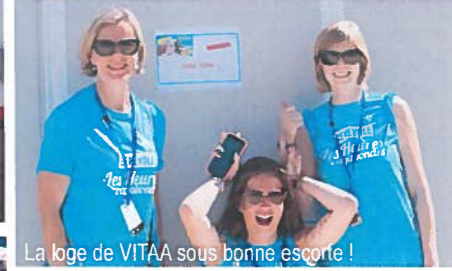
La loge de VITAA sous bonne escorte !