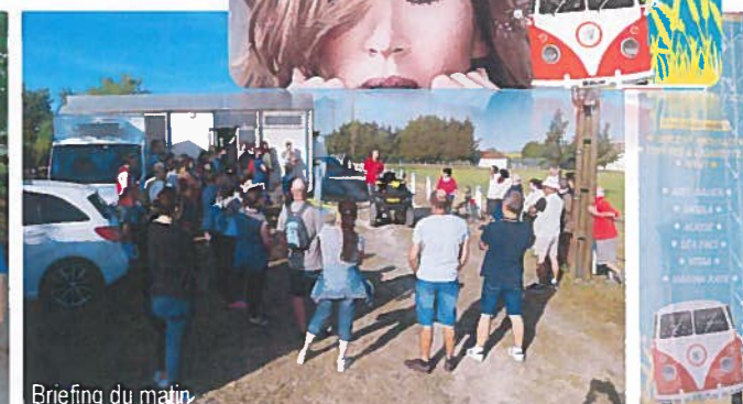
Briefing du matin