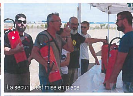
La sécurité est mise en place