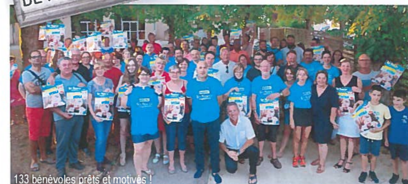
133 bénévoles prêts et motivés !