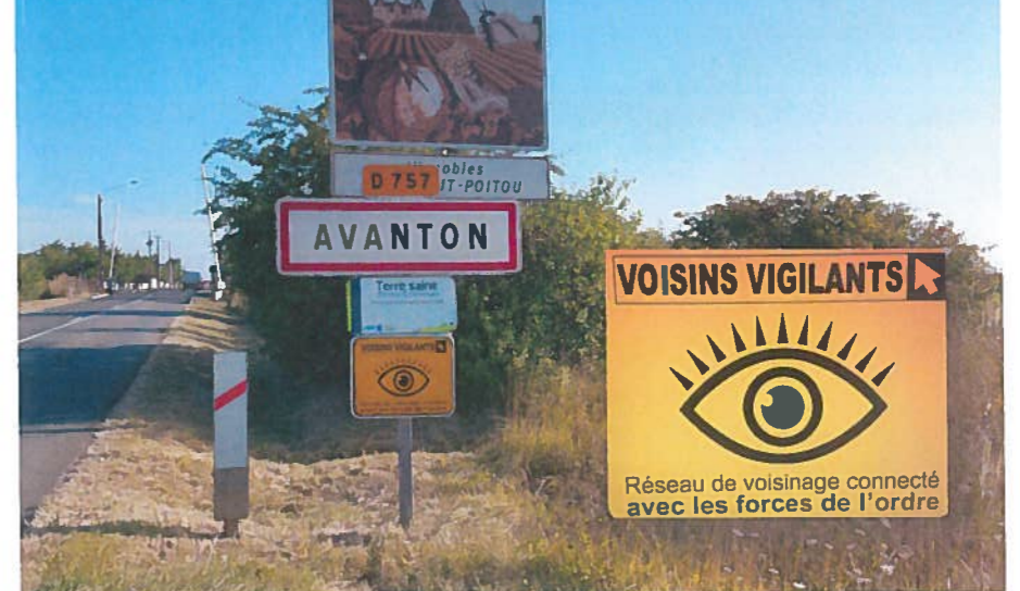
La commune a adhéré au dispositif «Mairie Vigilante» depuis le 1 er juillet 2016. Voir article en page 3.

Soyons vigilants ! Maison de santé Maison seniors Nouvelle rue de la Gare Fête nationale du 14 juillet Asso en Music Listes électorales Infos diverses... Bonne lecture !