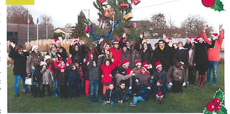
Un sapin haut en couleurs avec tous les paquets cadeaux venus orner le roi des forêts. Les enfants et parents étaient au rendez-vous le 5 décembre dernier pour cette manifestation fortement attendue ; un goûter aux notes de cacao et chouquettes a clôturé cette 2ème édition. SUITE EN PAGE 3

Joyeuses fêtes ! BILAN 2015, PERSPECTIVES Avanton mémoire MISSION LOCALE On s'fait un tennis ? FETE DU TIMBRE Les mariages 2015